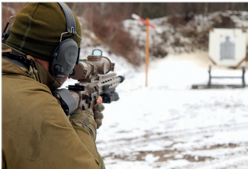
Malgré la pluie et le froid engendré par un dernier soubresaut de l'hiver, les tireurs d'élite du 1 R22 e R ont fait preuve d'une grande concentration lors de l'essai de leur nouvelle arme de service C20, le 19 avril, dans les secteurs d'entraînement de la Base Valcartier.

Depuis son arrivée au Régiment l'an dernier, il s'agit de la première fois que la C20 est utilisée dans le cadre d'un exercice de tir instinctif par les membres du 1 R22 e R. «Nos observateurs seront équipés de cette arme lors des patrouilles qu'ils pourraient mener en mission. L'exercice prévoit plusieurs menaces prenant la forme de cibles à courte et moyenne distance des participants», détaille le coordonnateur de l'exercice que nous ne pouvons identifier pour des raisons de sécurité opérationnelle.