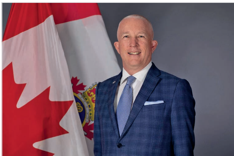
Gregory Lick, l'ombudsman du ministère de la Défense nationale et des Forces armées canadiennes, est en poste depuis 2018 et son mandat se terminera en 2024. / Gregory Lick is the ombudsman for the Department of National Defence and the Canadian Armed Forces, since 2018. His term will end in 2024.

L'ombudsman du MDN et des FAC a fait ses débuts dans la Réserve navale en 1981 et, en 1985, il s'est joint à la Garde côtière canadienne comme élève-officier mécanicien. Il a ensuite gravi les échelons pour atteindre, en