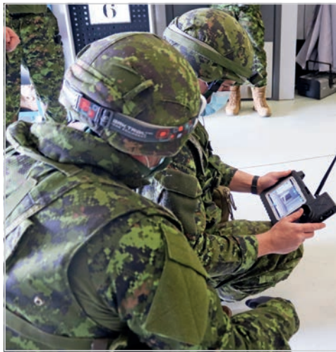
Ces deux participants à l'exercice FOX FOUILLEUR manœuvrent à distance le robot Nerva dans un parcours urbain truffé d'obstacles et de dangers (simulés).

Le Cplc Lavoie mentionne que le robot Nerva est doté de plusieurs technologies de pointe comme une caméra rotative pouvant couvrir plusieurs angles, une vision de nuit infrarouge, un faisceau éclairant, ainsi qu'un