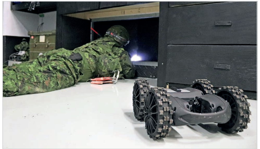
Avec grande précaution, ce membre du 5 RGC tente de se frayer un chemin par le sous-sol du bâtiment de simulation. Il peut compter sur le robot roulant Nerva pour l'assister.

«Le robot peut être lancé à travers une fenêtre. Il est conçu de manière à pouvoir continuer de se déplacer même s'il est positionné à l'envers. Ce modèle peut aussi transporter des charges explosives. C'est assurément un atout important pour diminuer les risques lorsque