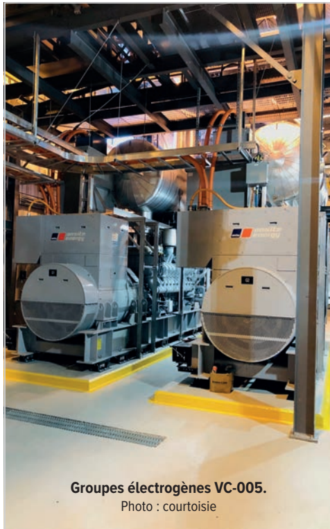
Groupes électrogènes VC-005.

Maintenant que la Base Valcartier a mis le tout à l'essai, quels sont les constats? Au moment de rédiger cet article, le crédit accordé par Hydro-Québec a permis à la Base Valcartier de toucher 385 000 $ en redevances à la fin de la saison froide 2020-2021. En contrepartie, les génératrices ont consommé pour environ 40 000 $ de diesel. On peut donc en conclure que la participation au programme GDP est