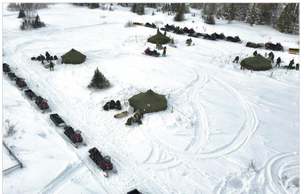
Quelques jours de «camping d'hiver» gratuit dans les grands espaces du Nord québécois.