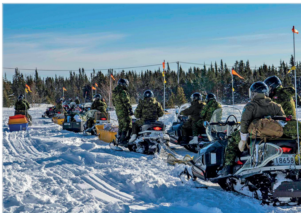
Les participants à l'exercice GUERRIER NORDIQUE ont complété de multiples scénarios de recherche et de sauvetage en bravant la rigueur de l'hiver canadien. La cohésion et l'entraide étaient alors les deux mots d'ordre.

«Plusieurs précipitations de neige atteignant 35 centimètres ont aussi poussé les troupes à faire preuve de flexibilité et de polyvalence pour conserver une bonne mobilité sur le terrain. Certaines routes ont même été fermées en raison de la surabondance de neige. Les participants ont dû porter une attention parti-