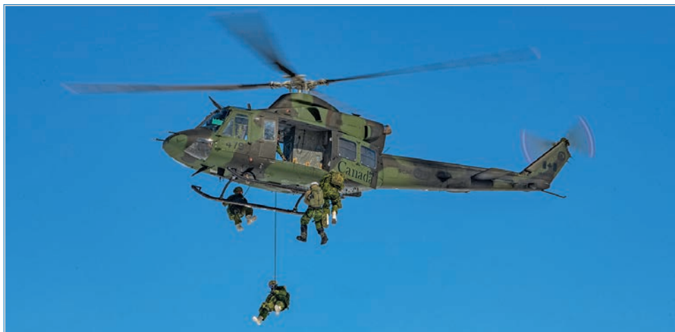
Les membres du 430 ETAH ont soutenu l'exercice du GCIA lors de plusieurs simulations aériennes de recherche et de sauvetage, d'élingage et de saut en rappel à partir d'un hélicoptère.