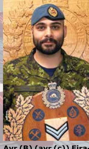
Avr (B) (avr (c)) Eirabie - promoted to Aviator (Trained) | a été promu au grade d'aviateur (formé).