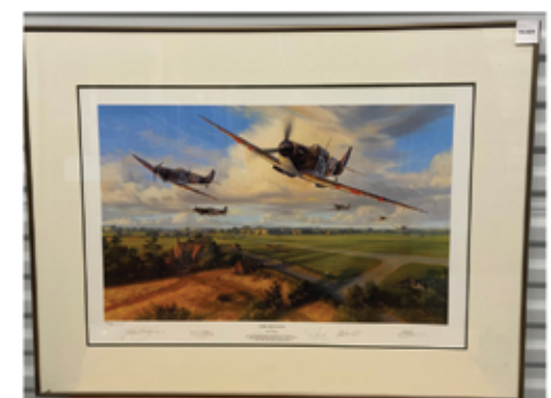
Many pieces of artwork in the CAFM collection are currently available to loan.