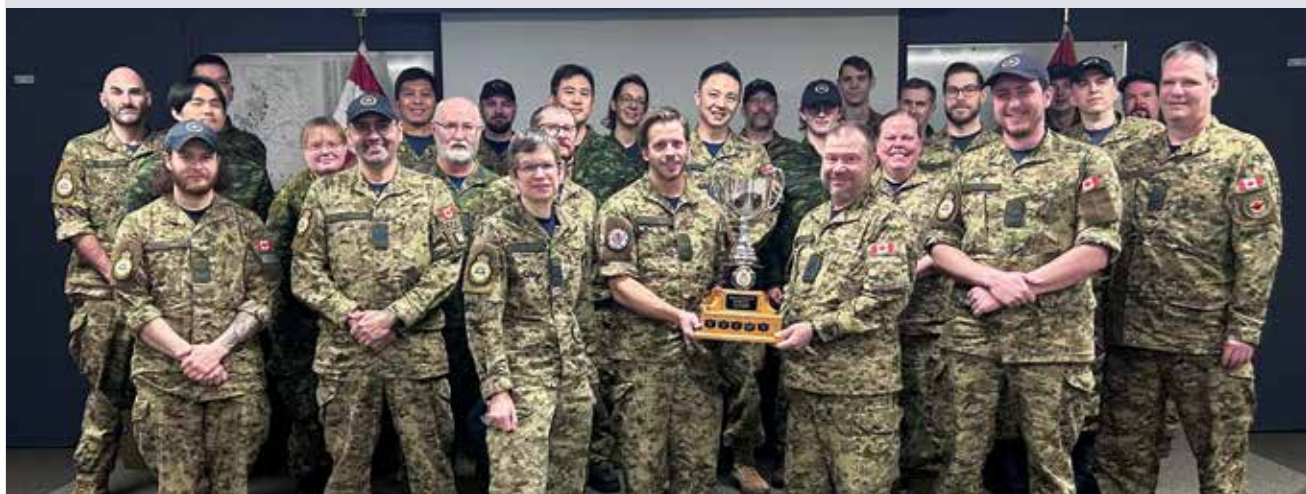
19 Air Maintenance Squadron - winners of the 2025/26 Commander's Cup | 19 e Escadron de maintenance (Air) - lauréat de la Coupe du commandant 2025-2026.