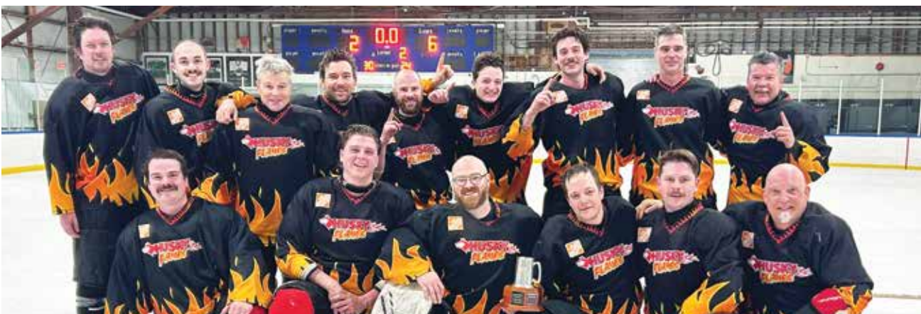
Comox Valley Fire Fighters - 19 Wing Hockey League Pool A winners - 6-2 over the 19 MSS Engineers | Pompiers de la Comox Valley - vainqueurs de la poule A de la Ligue de hockey de la 19 e Escadre – victoire de 6 à 2 contre les ingénieurs du 19 e ESM.