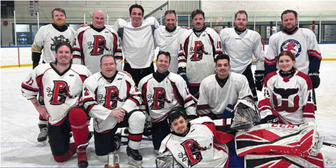
407 Sqn - 19 Wing Hockey League Pool B winners - 5-1 over the RCMP | 407 e Esc - vainqueur de la poule B de la Ligue de hockey de la 19 e Escadre – victoire de 5 à 1 contre la GRC.