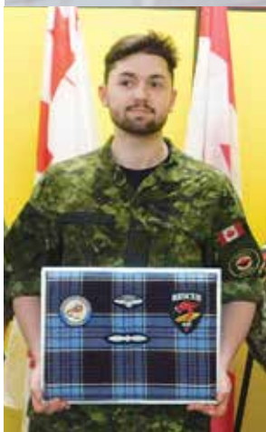
Avr B (avr (c)) Heighengton - promoted to Aviator (Trained) | a été promu au grade d'aviateur (formé).