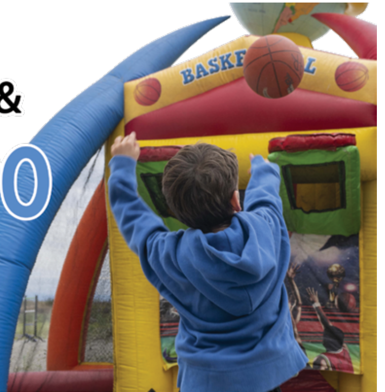
Cpl Raj Dhagat