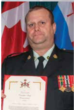
WO (adj) Kentfield - Commander Canadian Army Commendation | recommandation du commandant de l'armée canadienne