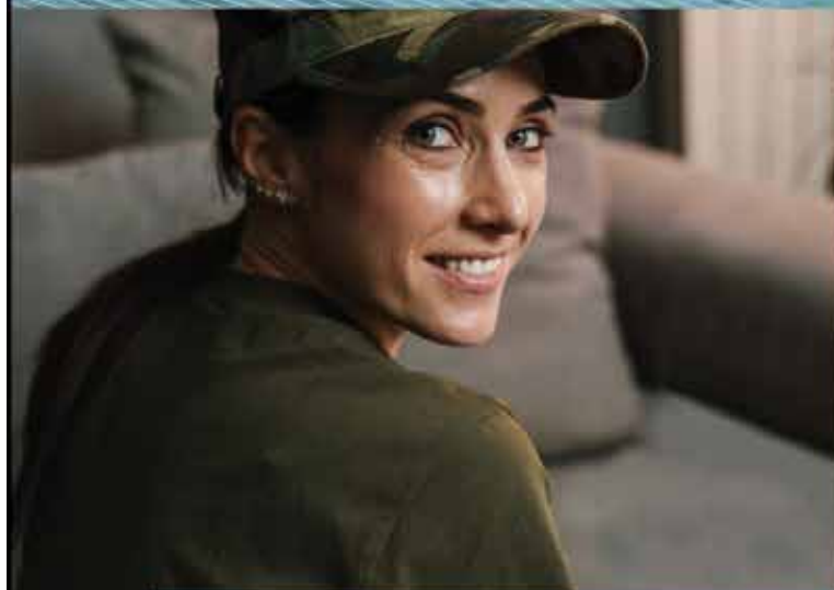
Georgia Strait Women's Clinic is Canada's only trauma program exclusively serving women